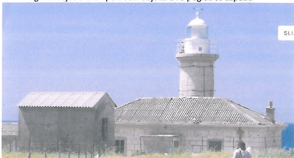
Zgrada svjetionika i pomoćni objekt 2 pogled sa istoka