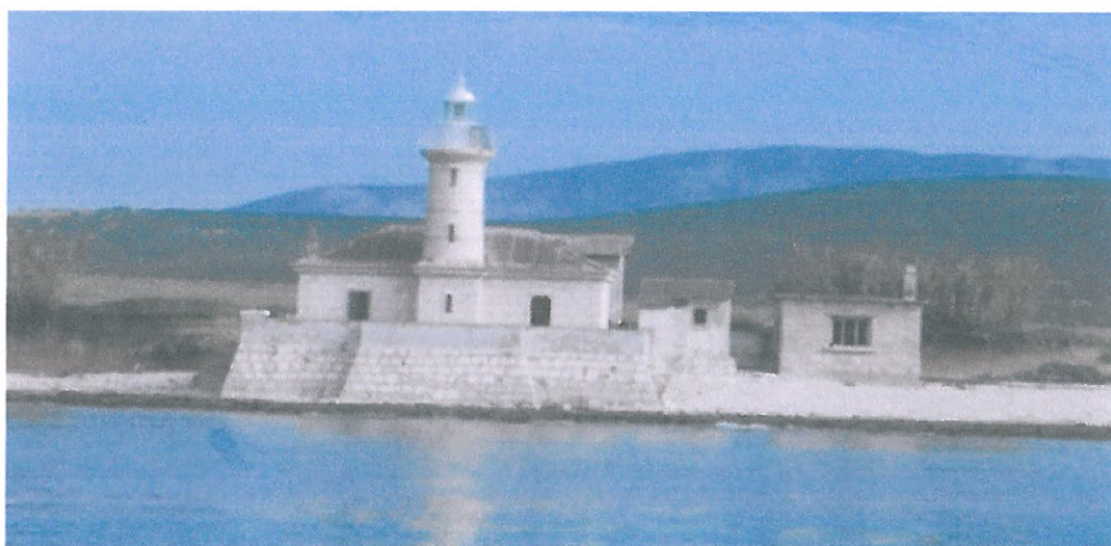
Zgrada svjetionika i pomoćni objekti 1 i 3 pogled sa zapada